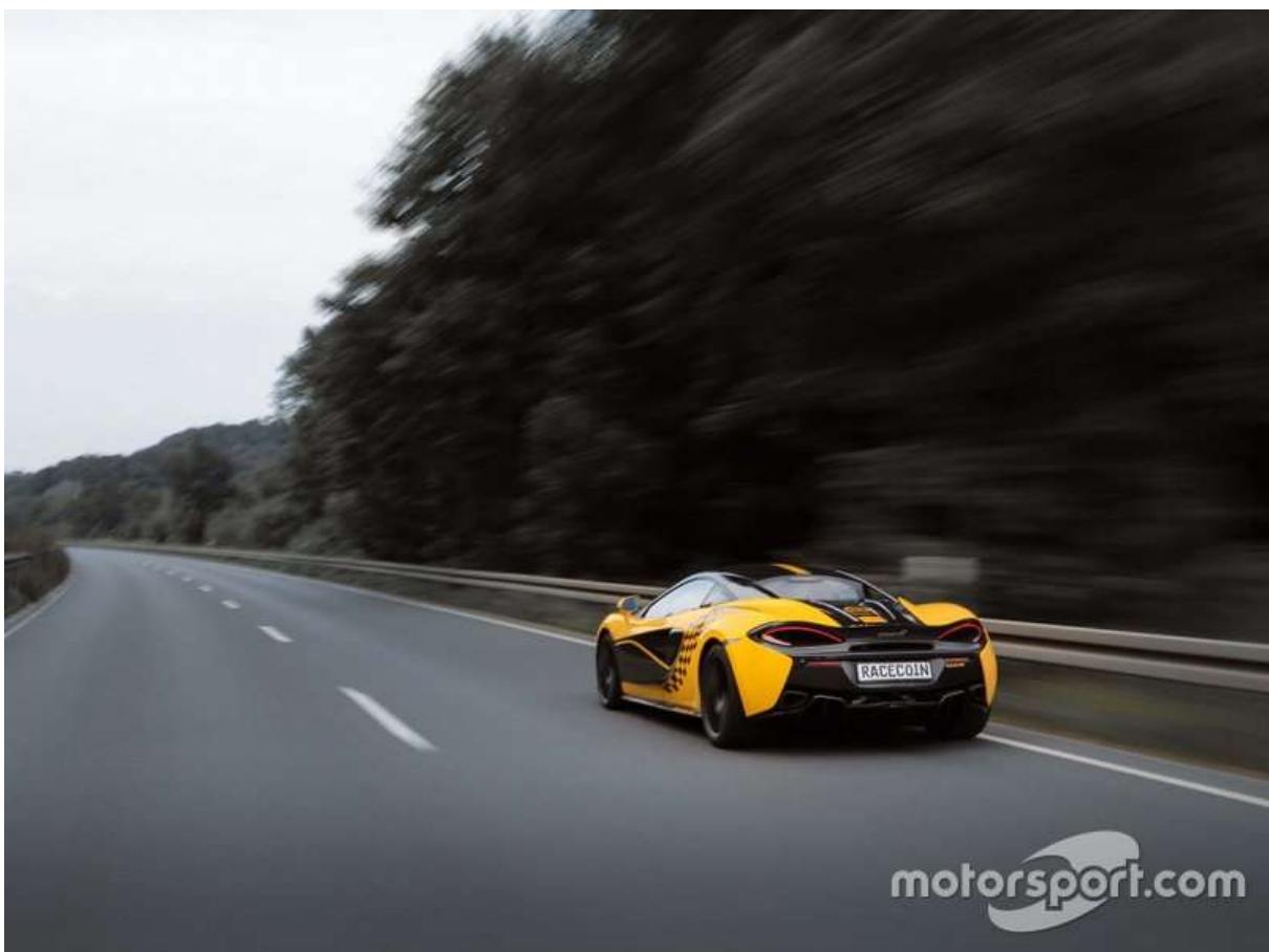
McLaren en livrée RaceCoin, essieu arrière

Le principe est de permettre à un nombre infini de pilotes de se mesurer les uns aux autres, quel que soit leur localisation géographique, quel que soit le circuit sur lequel ils évoluent, quelle que soit la voiture avec laquelle ils évoluent, et même quelles que soient les conditions météo !